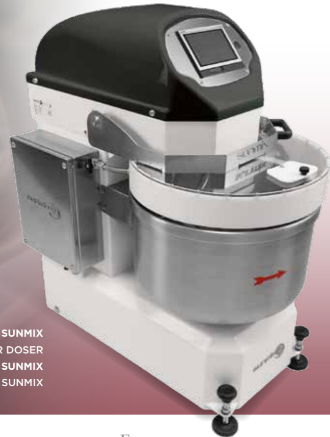
DOSATORE D'ACQUA SUNMIX SUNMIX WATER DOSER DOSEUR D'EAU SUNMIX DOSIFICADOR DE AGUA SUNMIX